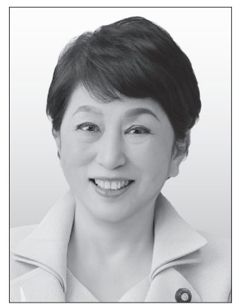
社会民主党党首 福島みずほ