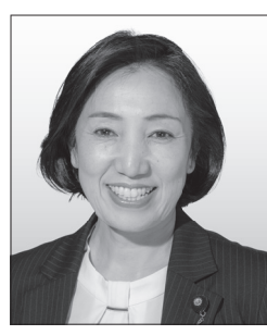
【肩書き・経歴】参議院議員、社民党副党首 【政策】労働問題、差別と人権、貧困・格差問題