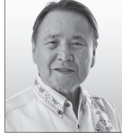
【肩書き・経歴】沖縄平和運動センター元議長、社民党常任幹事 【政策】沖縄・日本を戦場にさせない 平和外交の確立を