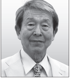
【肩書き・経歴】市民平和運動家、銀行員として海外に駐在 【政策】自衛隊を「国際災害救助即応隊」に衣替え