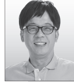
【肩書き・経歴】新社会党市民運動委員長 【政策】日米合同委員会廃止、水道民営化に反対してきた