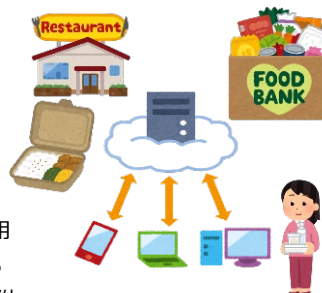
【食品ロス削減・食品寄附促進 アプリ等の活用】